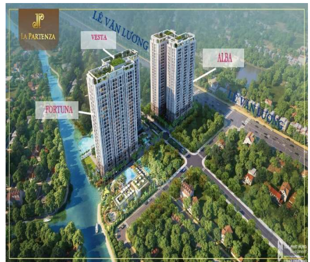
Hình 2. Mô phỏng dự án La Partenza

Nguồn: KHG, Mirae Asset Việt Nam Research